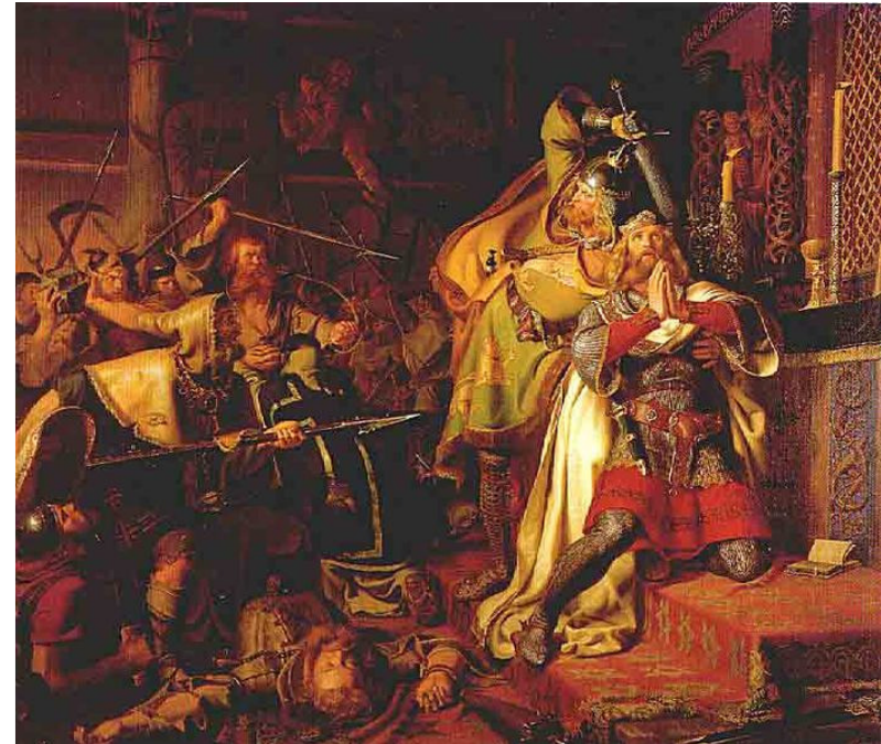
Der Tod Knuts des Heiligen, historisierendes Gemälde aus dem Jahr 1843

Knut IV. der Heilige (* 1043; † 10. Juli 1086 in Odense) war König von Dänemark. Er war der Sohn von Sven II. Estridsen. 1080 folgte er seinem Bruder Harald III. auf den Königsthron. Er versuchte, die Kompetenzen des Königturns auszuweiten. Durch eine kirchenfreundliche Politik suchte er die Unterstützung der Bischöfe. Einige Quellen behaupten, dass er die Anordnung gegeben habe, die Weihnachtszeit auf insgesamt 20 Tage bis zum 13. Januar, dem so genannten St.-Knut-Tag, zu verlängern. Als er 1086 Truppen zusammenzog, um England zu erobern, brach ein Volksaufstand aus. Grund waren weniger seine Expansionspläne als seine wiederholten Eingriffe in die überlieferte Rechtsordnung des Landes. Knut und sein Bruder Benedikt wurden in der von ihm errichteten St.-Albans-Kirche erschlagen, der heutigen Knutskirche. Da Knut für seine kirchenfreundliche Politik bekannt war und in einer Kirche erschlagen wurde, wurde er zum Märtyrer erklärt. 1101 wurde er heilig gesprochen. Festtage sind der 19. Januar und der 10. Juli. Er ist der Schutzpatron Dänemarks.